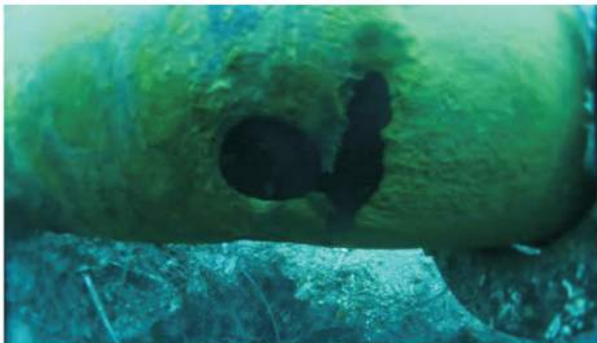
Perdita idrica a mare

Nel corso degli ultimi anni, numerose sono state le perdite idriche che hanno coinvolto le condotte sottomarine, con notevoli disagi alle popolazioni isolate ed alle attività ricettive allorquando tali disservizi capitavano nei periodi estivi.