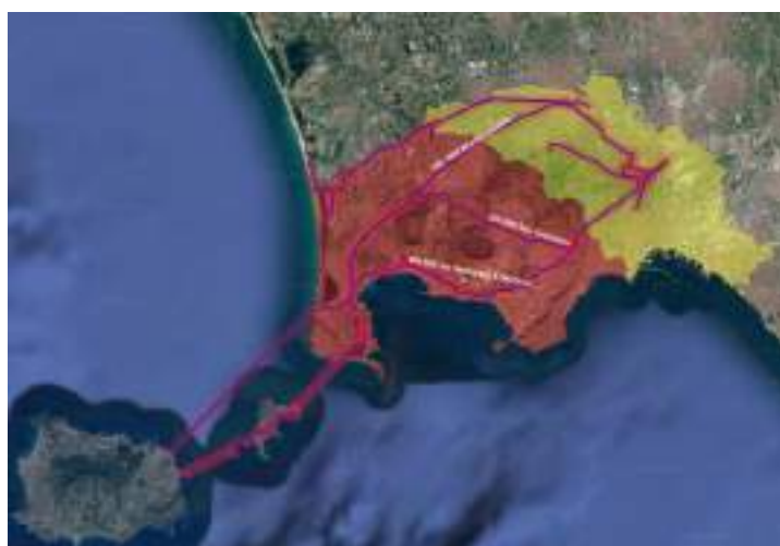
Figura 1 Sistema di adduzione primaria insistente nella Zona Rossa

Nell'ottica di monitorare lo stato di funzionamento del Sistema, a valle di un evento sismico, è necessario implementare i punti di misura lungo le tratte idriche, al fine di rilevare lo stato (rotture/perdite) delle reti e valutare l'effetto su di esse del movimento tellurico.