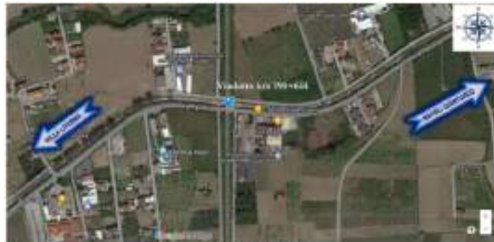
Inquadratura su ortofoto

Di seguito si riporta l'inquadratura della stessa su ortofoto.