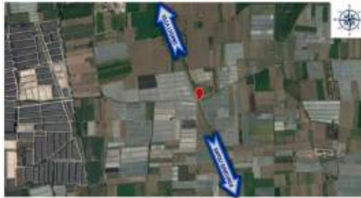
Aggraffamento ai cordoli