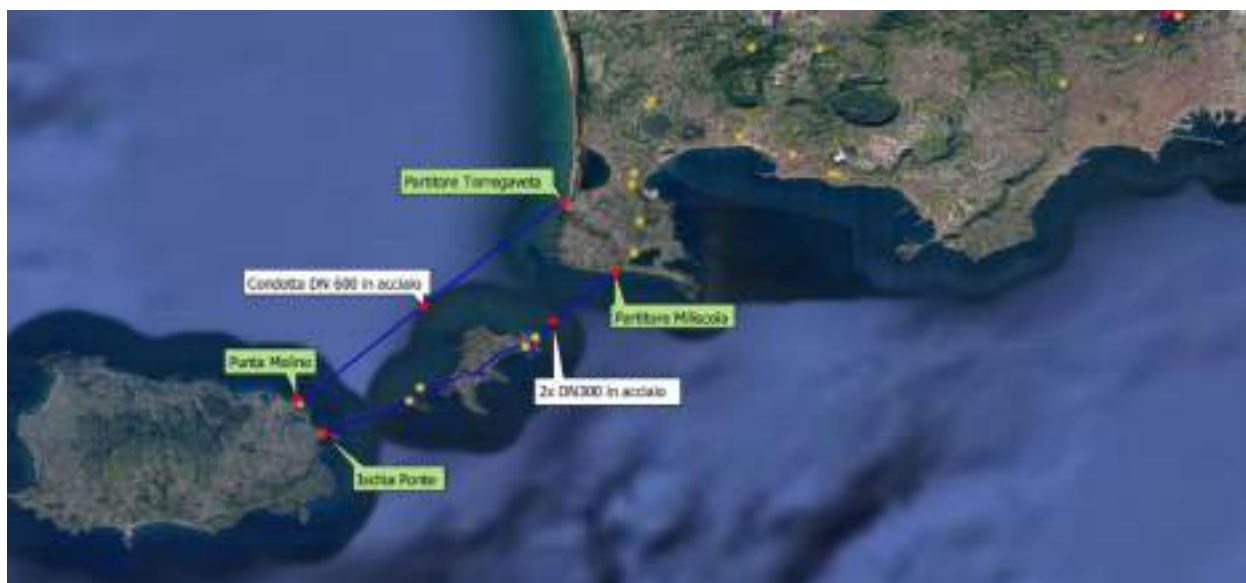
In blu – condotte oggetto di intervento

L'intervento in oggetto si inquadra, in un'azione complessiva di ristrutturazione puntuale che garantisce un risultato stabile e duraturo i cui benefici si estenderanno anche all'ordinario funzionamento. L'intervento proposto riguarda in linea generale: