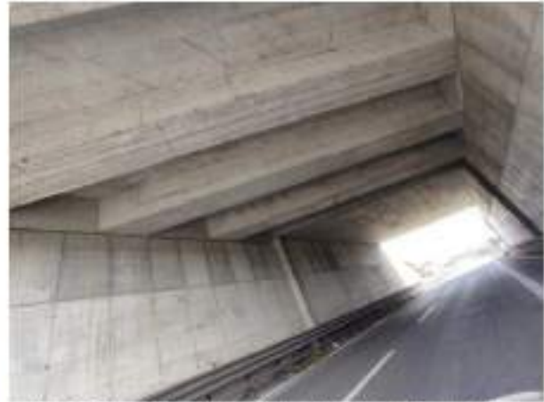
Impalcato – Venature di ruggine lungo le armature