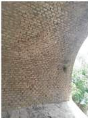
Volto - Infiltrazioni attraverso la muratura e perdita di materiale nelle giunzioni