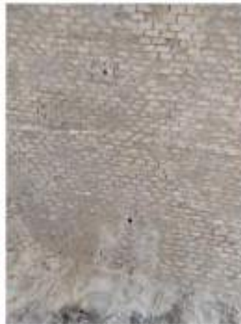
Volto - Infiltrazioni attraverso la muratura e perdita di materiale nelle giunzioni