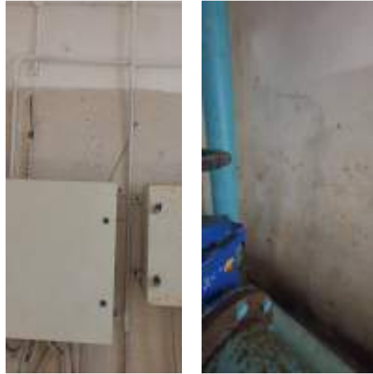
Vista interno vasche