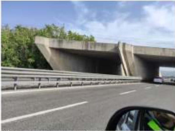
Spalle ed impalcato – Macchie di umidità, dilavamento