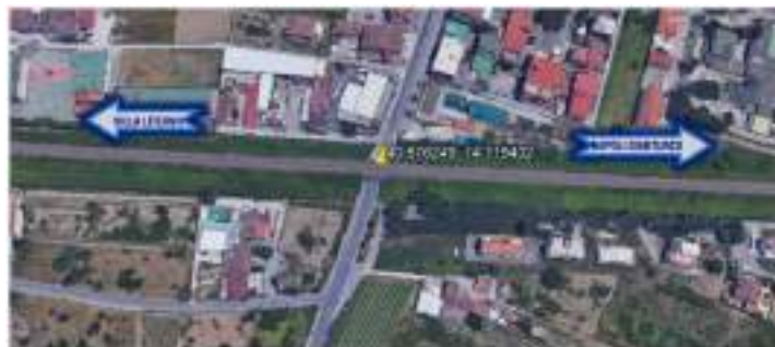
Inquadramento su ortofoto

Di seguito si riporta l'inquadramento della stessa su ortofoto.