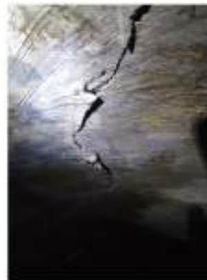
Fessurazioni individuate lungo la volta e le pareti

L'intervento di messa in sicurezza a protezione della condotta, prevedrà l'installazione di centine in acciaio collegate tra loro all'intradosso dell'esistente rivestimento murario di galleria.