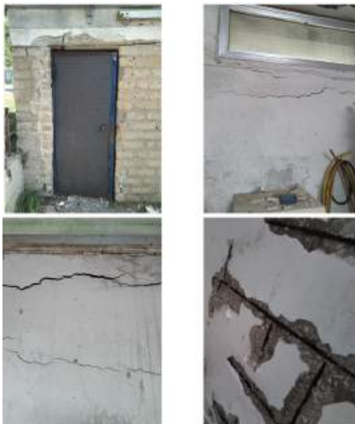
Locale misuratori e monitoraggio protezione catodica

Si riporta di seguito lo stato attuale del locale oggetto di intervento: