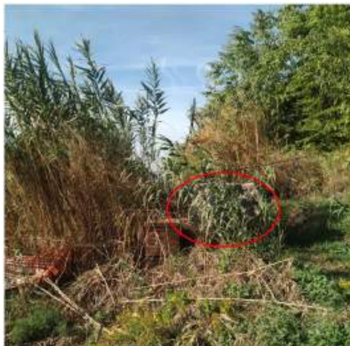
Ammasso roccioso in prossimità del tracciato

Probabilmente, proprio l'ultimo crollo, ha causato il distacco dell'ammasso roccioso rinvenuto in prossimità del tracciato di condotte anzidette: