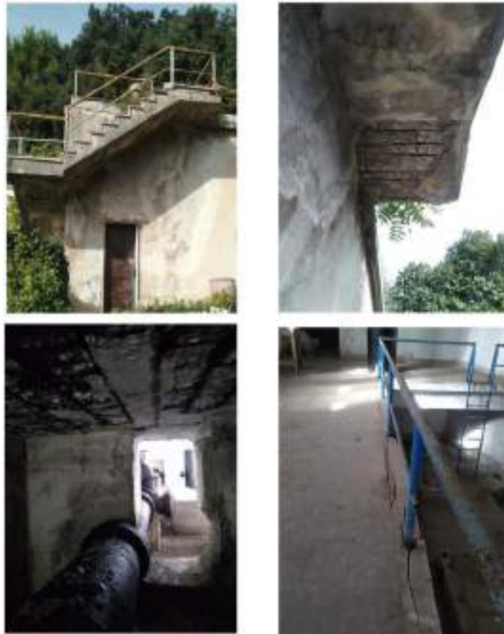
Ex Stazione di sollevamento "Villa Arabia"

I lavori dovranno prevedere il recupero delle opere civili in modo da ripristinare il grado prestazionale degli elementi strutturali e garantire il buon funzionamento dell'intera opera.