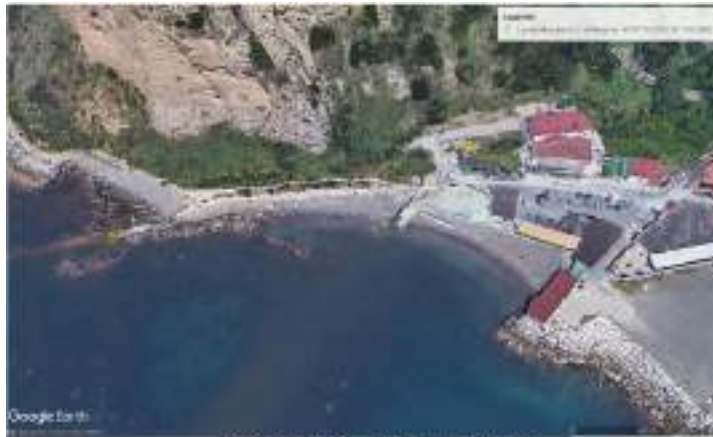
Oriente con indicazione del locale oggetto di intervento