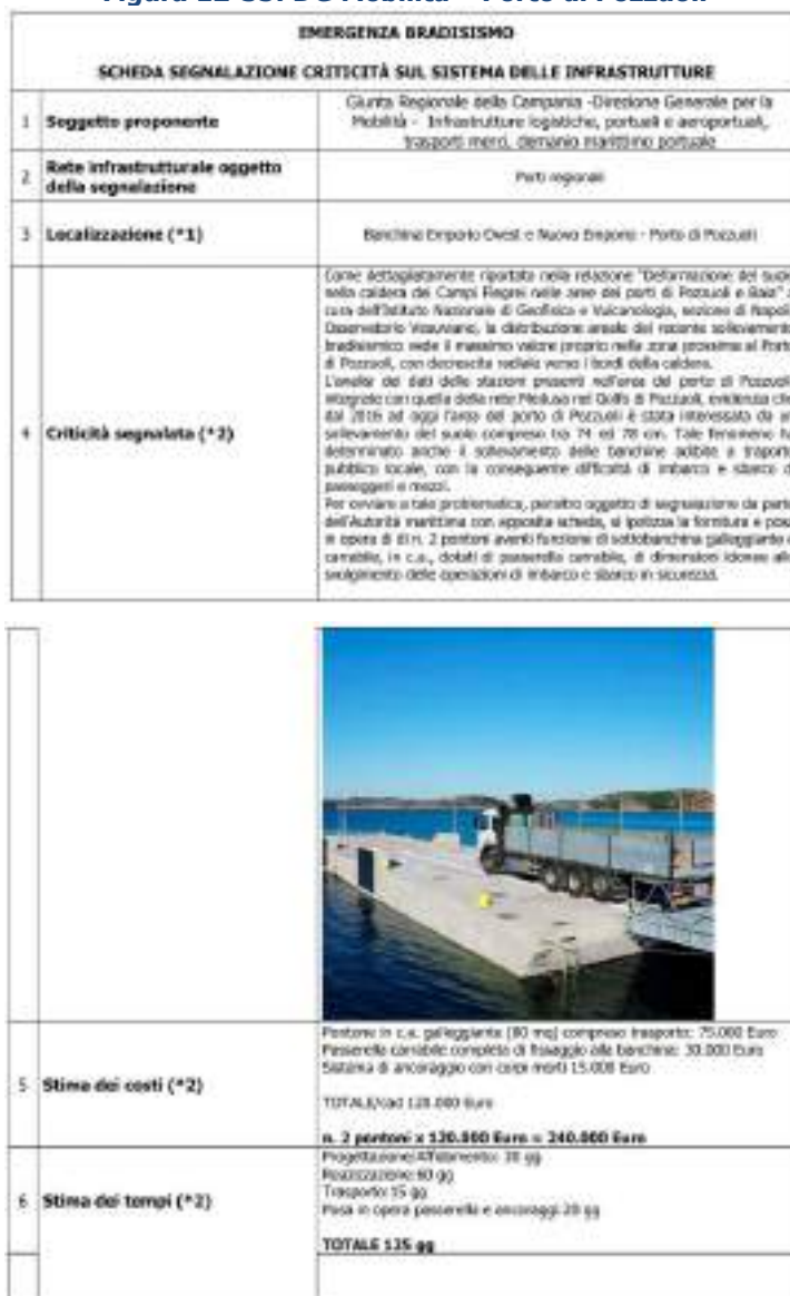
Figura 12-35: DG Mobilità – Porto di Pozzuoli