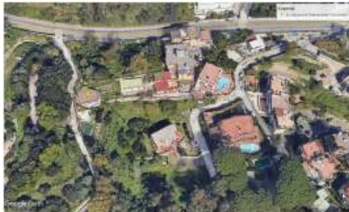
Ortofoto con indicazioni del sito intervento

L'opera oggetto di intervento è l'ex stazione di sollevamento denominata “Villa Arabia”, oggi non più utilizzata, oggetto comunque di periodici sopralluoghi in quanto attraversata dalla condotta DN 550 in ghisa. Tale condotta, partendo dal Serbatoio di Santo Stefano, in Via Pigna – Napoli, con una portata media di 330 l/s, alimenta gran parte delle utenze tra i Comuni di Pozzuoli, Bacoli e Monte di Procida.