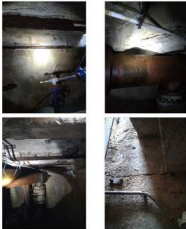
Camera di manovra

I lavori dovranno prevedere il recupero delle opere civili in modo da ripristinare il grado prestazionale degli elementi strutturali e garantire il buon funzionamento dell'intera opera.