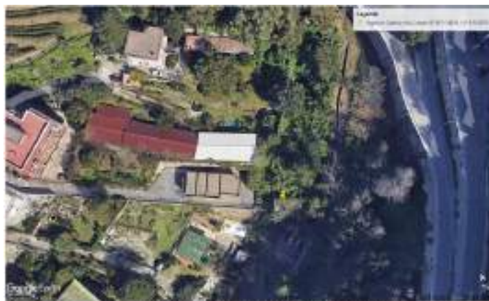
Oriente con indicazione del punto di ingresso della galleria

L'opera oggetto di intervento è la galleria denominata “Galleria Villa Cariatì”. In essa è presente una condotta DN 550 in ghisa. Tale condotta, partendo dal Serbatoio di Santo Stefano, in Via Pigna – Napoli, con una portata media di 330 l/s, alimenta gran parte delle utenze dei Comuni di Pozzuoli, Bacoli e Monte di Procida.