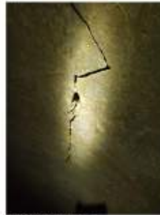
Fessurazioni individuate lungo la volta e le pareti