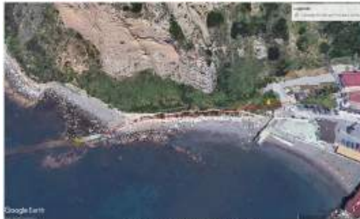
Orizzonte con indicazione del tratto interessato

Le 2 condotte Dn 300 oggetto di intervento, alimentano le isole di Procida e Ischia. In particolare, nella presente relazione, si pone l'attenzione sulla parte di tracciato compreso tra la camera di manovra, prospiciente il sentiero Torefumo in località Santolillo - Miliscola e il punto di approdo verso le isole.