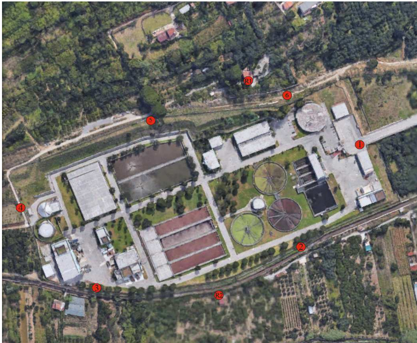
Planimetria punti di monitoraggio rumore